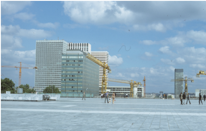
Vue prise du parvis du quartier de ..... Juillet 1970 / Auteur non identifié