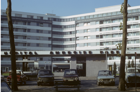
Façade de l'hôpital Ambroise Paré à Boulogne Billancourt / Juillet 1970