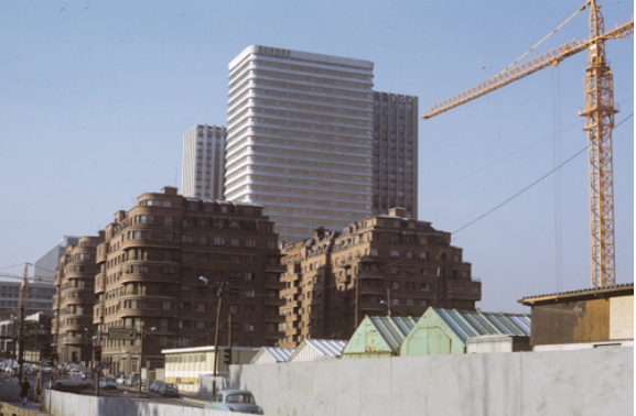
Construction de la tour Aurore, quartier de ... Juillet 1970