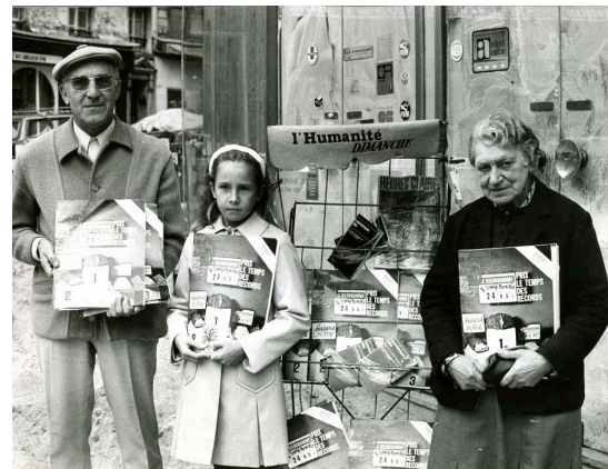
Vendeurs de l'Humanité dimanche Auteur : non id.