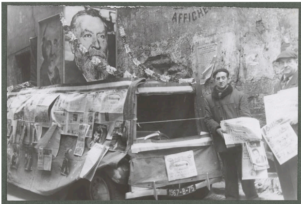
Deux vendeurs dans une rue dans le quartier de Belleville Avril 1954 / Auteur : non id.