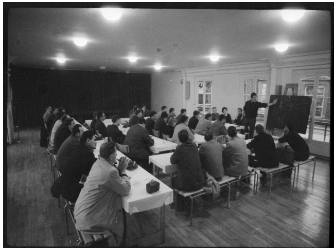
Ecole photo des correspondants de l'Humanité 1967