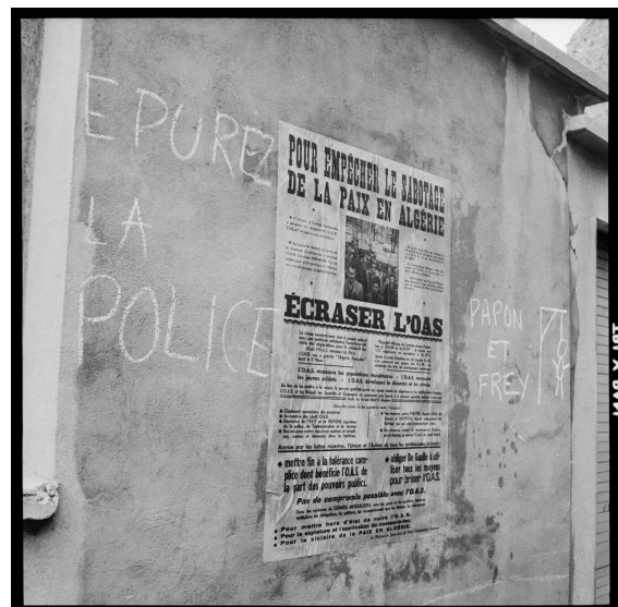
Attentat OAS Issy-les-Moulineaux et manifs. 1.05.1962