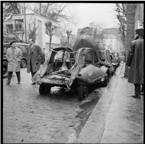
Attentat OAS Issy-les-Moulineaux 1.05.1962