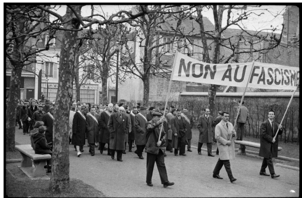
Manifestation anti-OAS à Nanterre. 18.02.1962