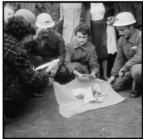
Marche des mineurs sur Paris (13 mars 1963)