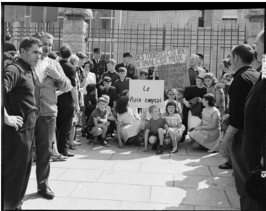
« Des touristes c'est bien, le travail c'est mieux » Forges de Hennebont (Morbihan) 1966