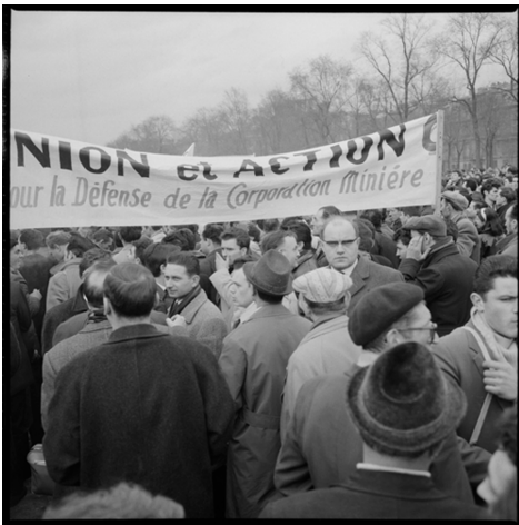
Marche des mineurs sur Paris (13 mars 1963)